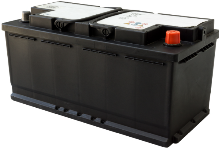
Autobatterie zur Veranschaulichung einer Energiemenge von 1 kWh

Wollte man die Energie, die jeder von uns ständig (ver-)braucht, mit Leistungssportlern auf Treträdern erzeugen, müssten für jede und jeden von uns 50 (!) Menschen rund um die Uhr treten. Daher ist die Vorstellung absurd, jemand könne durch Treten eines Energie-Fahrrades seinen Energiebedarf decken. Mit diesem Hintergrundwissen wird klar, welch immense Energiemengen unseren gewohnten Lebensstil ermöglichen.